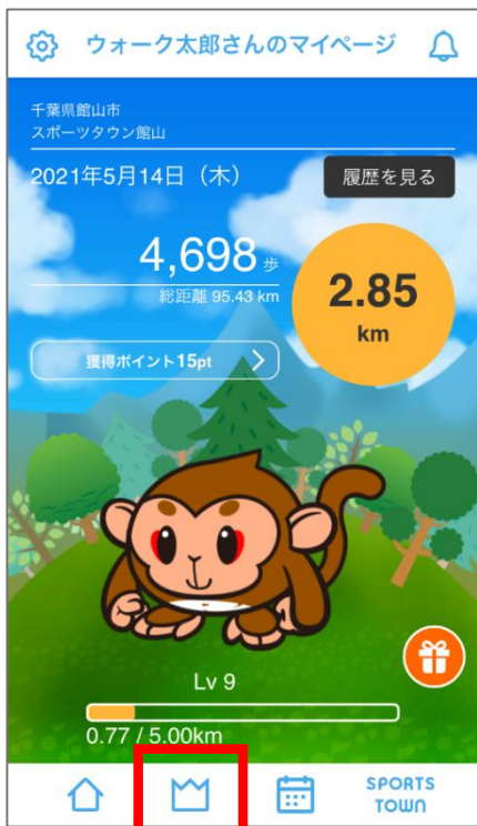
画面下部の王冠マークをタップ